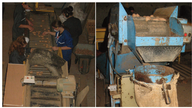
Dernier triage des pommes de terre bio avant ensachage

2) Renforcer l'expérimentation pour se rapprocher des professionnels en développant des pratiques respectueuses de l'environnement. Plusieurs essais ont été mis en place, à la demande des partenaires ou de l'établissement :