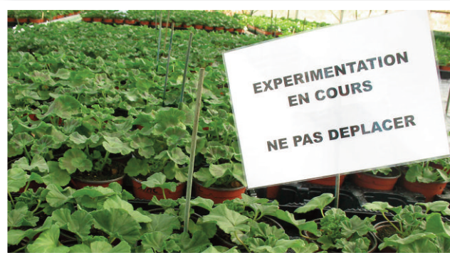
Essai de purins sur Pélargoniums pour la société FORTIECH

Il fallait un coordinateur pour piloter cette démarche collective. Rentrant de congés de maternité, compte tenu du peu d'enthousiasme des équipes malgré une décharge d'enseignement significative, je me suis retrouvée investie du projet par ma direction.