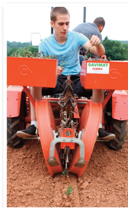
Plantation de menthe poivrée

Les essais financés par ces deux sociétés renforcent la crédibilité de l'établissement et sa capacité à accompagner l'innovation, tout en constituant un apport financier nouveau pour l'exploitation.