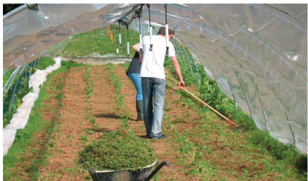
Récolte de roquette bio avec les BTS PH

Ces démarches demandent des temps de concertation et de coordination importants, difficiles à mobiliser pour les établissements fragiles ou en crise. Cette réalité nous a conduit à cibler les objectifs, en privilégiant la technique. Ce choix débouche toutefois sur deux résultats structurants pour l'avenir :