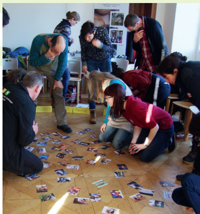
Des apprenants du CS Tourisme vert, accueil et animation en milieu rural aux rencontres EDD de la Grande Région. Projet TT de l'EPLEFPA Nancy-Pixerécourt.