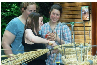
Des étudiantes des BTS Production animale et Sciences et techniques des aliments lors d'une formation au Luxembourg : Les abeilles à l'école. Projet TT de l'EPLEFPA Nancy-Pixerécourt.