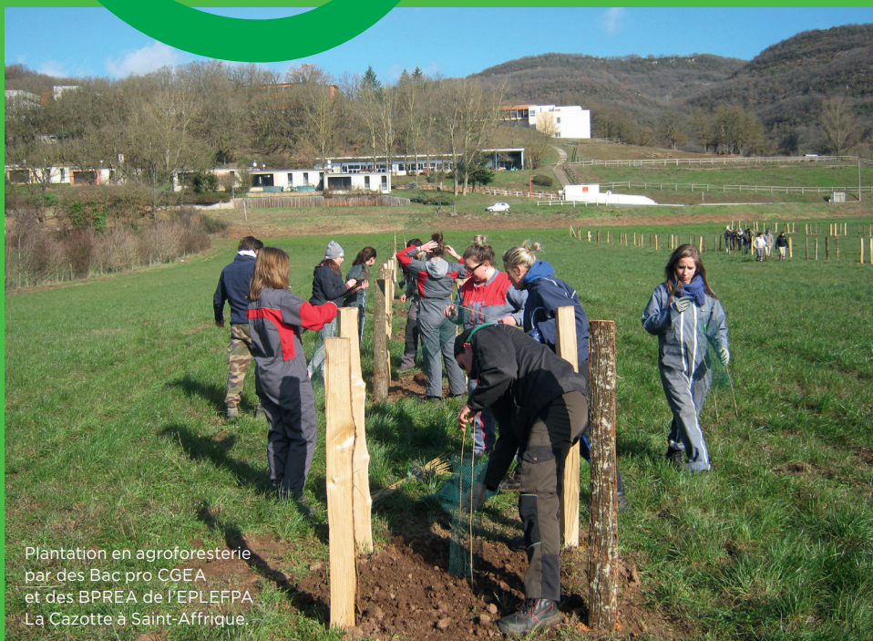
Plantation en agroforesterie par des Bac pro CGEA et des BPREA de l'EPLEFPA La Cazotte à Saint-Affrique.

Les 27, 28, 29 et 30 novembre 2017 CEZ-Bergerie nationale de Rambouillet