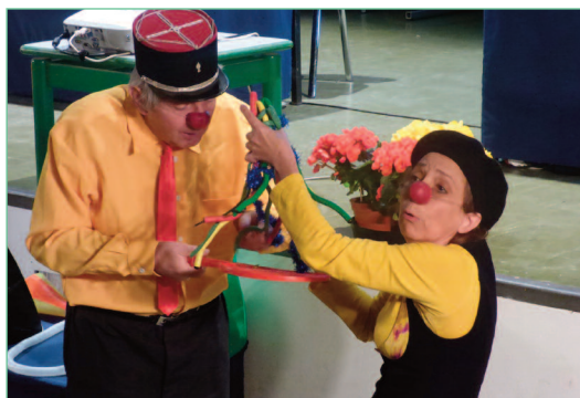
Imbrication du projet d'établissement et du projet tiers temps