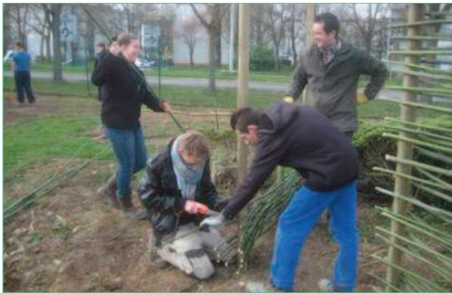
Les étudiants de BTS Aménagements paysagers réalisent une palissade en cannes de bambous.

Le projet tiers temps a aussi un impact pédagogique. Le Module d'Approfondissement Professionnel (MAP) « Suivi de la biodiversité » en terminale bac pro Gestion des milieux naturels et de la faune a été construit dans le cadre du projet tiers temps. Cela a permis à cette filière d'intervenir sur l'atelier technologique pendant toute l'année scolaire alors qu'elle le faisait très peu auparavant.