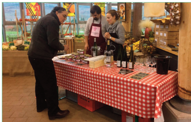
Magasin de vente de l'EPLEFPA de Rouffach - Wintzenheim

exploitations voire d'autres exploitations du territoire et enfin, à long terme, de créer un deuxième magasin de vente sur le site de Rouffach plus spécialisé en vins et d'intégrer des produits fabriqués par des producteurs locaux ou par d'autres EPL.