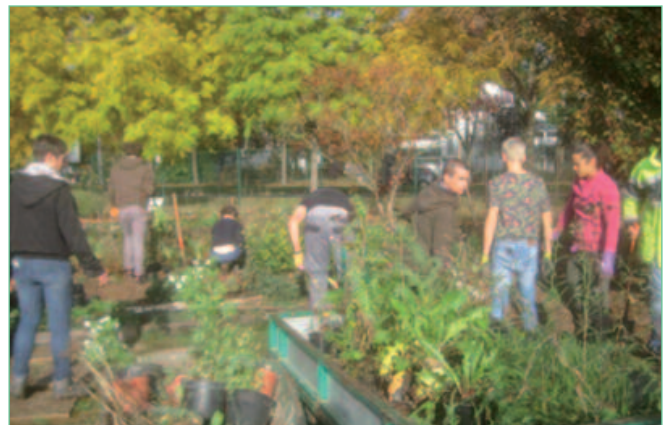
Les BP travaux paysagers du CFPPA plantent des végétaux vivaces sur le rond-point.

La pédagogie de relais constitue un exemple. L'idée est de travailler sur une continuité avec différents groupes. Entre novembre 2015 et avril 2016, une majorité des groupes du lycée, du CFA et du CFPPA sont passés sur le terrain. Le binôme tiers temps fait le lien entre les différents groupes. C'est un élément facilitateur important pour mener à bien le projet.